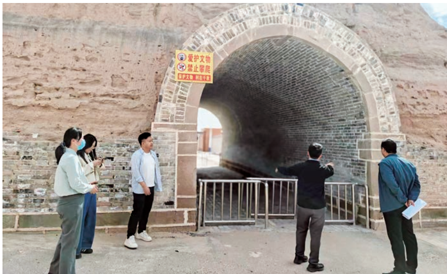
▲ 十五届盐池县委第三监督检查组在对惠安堡镇开展巡察“回头看”时，走访街道现场了解巡察反馈问题整改情况。

升工作规范化水平。充分考虑村（社区）体量规模大小、矛盾复杂程度、基层治理水平等差异，明确“一般情况一体巡、重点情况直接巡、特殊情况专项巡”工作标准，规定开展直接巡察比例不低于20%。结合纪检、组织、农业农村等职能部门年度重点任务制定巡察计划，精准确定巡察对象及方式。立足不同县域发展定位，将“四个聚焦”监督重点具体化，坚决防止监督跑偏走虚。红寺堡区聚焦全国最大易地搬迁移民集中安置区、国家乡村振兴重点帮扶县的县域定位，细化监督清单，围绕“搬得出、住得下、稳