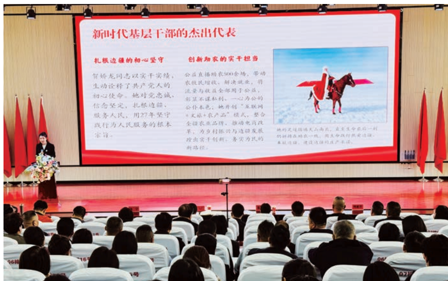
▲ 贺兰县纪委监委以“弘扬廉洁清风 筑牢纪律防线”为主题，精心组建廉政警示教育宣讲团开展巡回宣讲。

娇龙等先进典型扎根一线、实干为民、清廉奉公的感人事迹，引导党员干部感悟“功成不必在我、功成必定有我”的境界，校准政绩“方向盘”；以“反面警示敲警钟”切入，用身边事教育身边人，通过案例剖析、纪法解读，让党员干部筑牢拒腐防变思想防线；以“六大纪