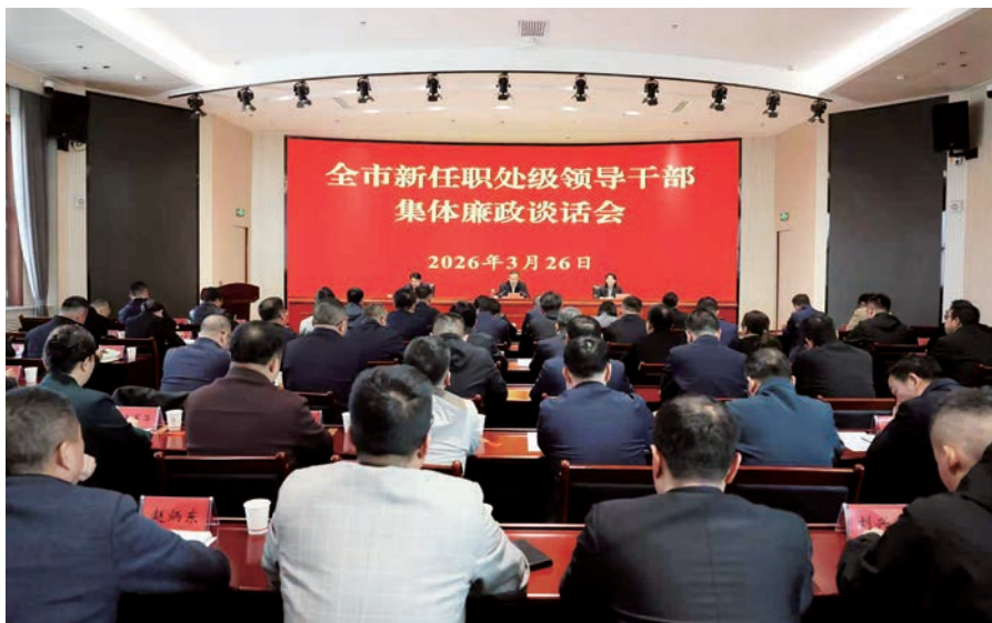
▲ 中卫市组织召开全市新任职处级领导干部集体廉政谈话会。

提拔干部、年轻干部、关键岗位干部教育力度，召开新任职处级领导干部集体廉政谈话会，对“一把手”强化权力监督，对年轻干部突出“青廉”教育，对重点岗位干部开展风险防控专题培训。谈心谈话传压力。严格落实“四谈”机制，对权力集中、资金密集等重点领域关键岗位干部“一对一”