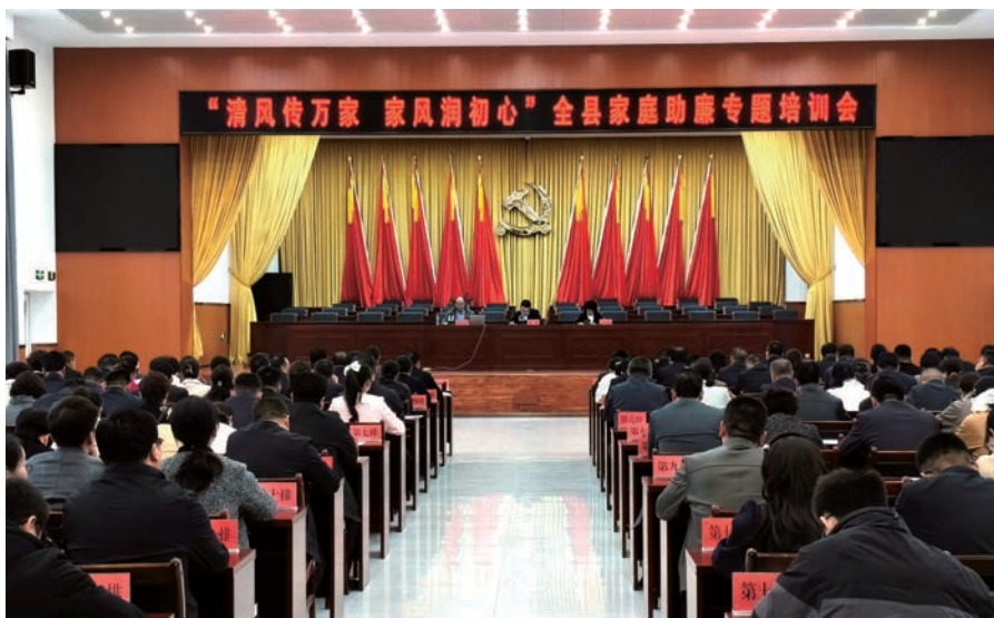
▲ 海原县召开“清风传万家 家风润初心”全县家庭助廉专题培训会。