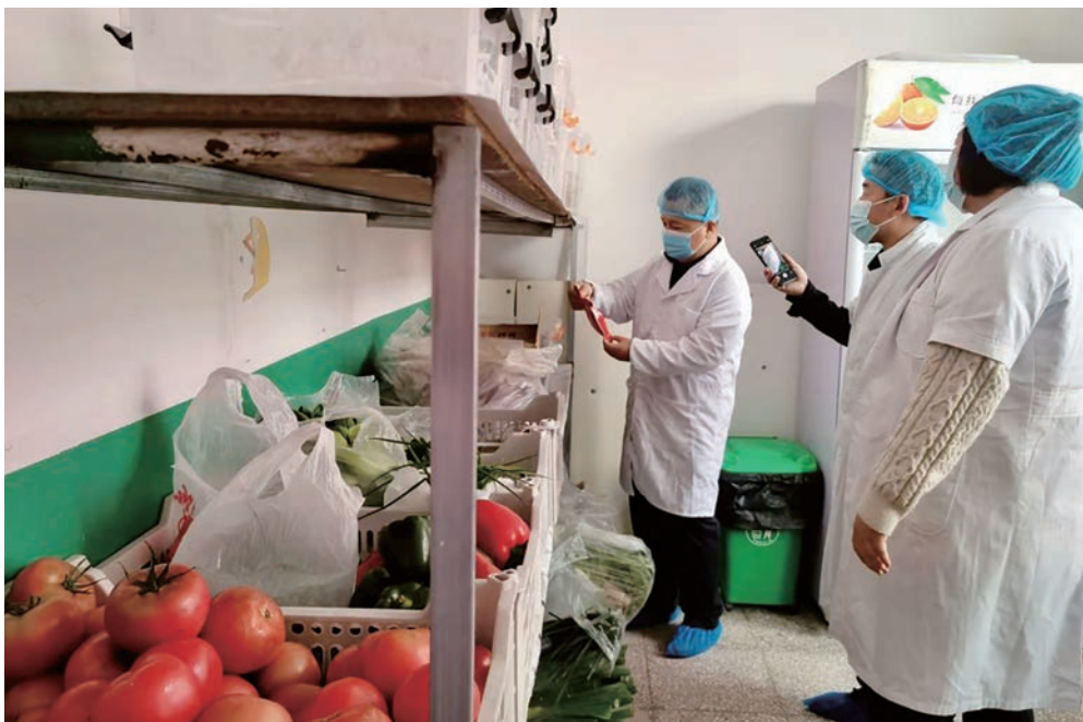
▲ 大武口区“巡纪联动”深入校园开展中小学“校园餐”专项检查。

违规违纪问题，切实维护教育系统的公信力和形象。因地制宜改进方式方法。立足对学校党组织开展巡察的实际情况，通过听推门课、走学生上学路等“沉浸式”监督做法，在不影响正常教育教学活动的前提下，深度参与体验“教师、学生的一天”。发现解决了一批学校周围商铺、流动商贩售卖“三无食品”、学生打架斗殴、教研活动环境差等制约广大师生获得感、幸福感、安全感的问题。