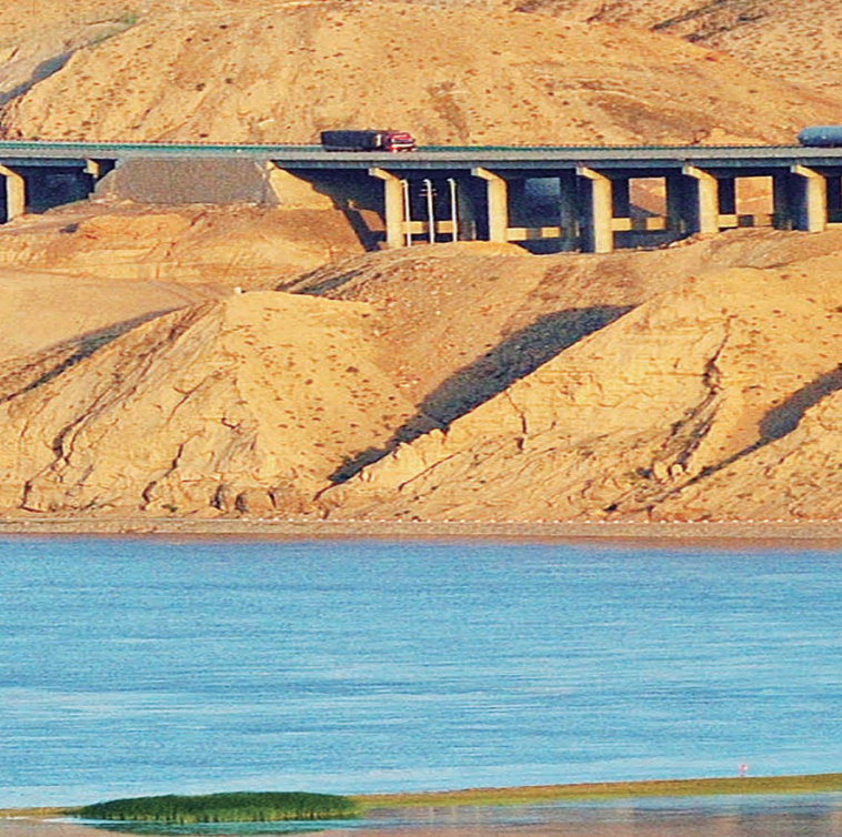
▲ 黄河宁夏段碧波荡漾、美景如画。

平……纪检监察机关通过强有力的监督执纪问责，督促有关部门打好蓝天、碧水、净土保卫战，一批突出的生态环境问题得到解决，生态环境治理取得阶段性成效。