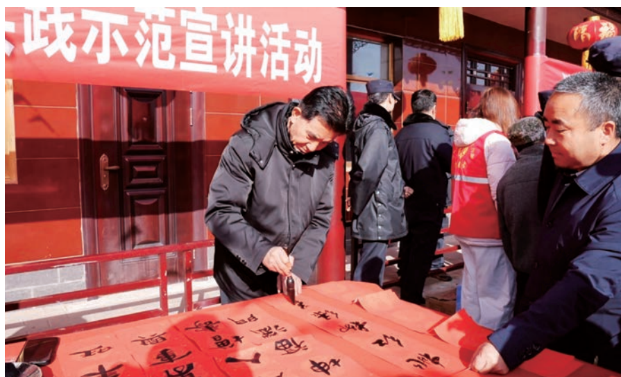
▲ 泾源县开展清风宣讲示范活动。

扎紧事中监督防线。建立“室组”联动监督、“室组地”联合办案、“四项监督”统筹融合、纪法衔接工作机制，将监察监督与派驻监督、巡察监督、审计监督等贯通融合，充分发挥“人员联动、案件联