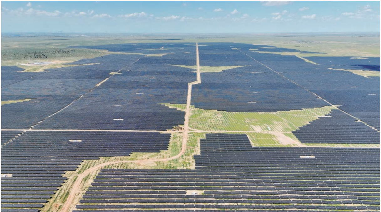
▲ 宁夏国有资本运营集团公司盐池高沙窝92万千瓦光伏复合项目。

电机组不低于5年，逆变器不低于5年，箱变为工程整体移交后2年，其他电气设备不低于2年，高标准的要求为项目未来的安全高效运营夯实了基础；同时实现了工程造价的大幅下降，灵武和盐池两个光伏项目计划投资67.5亿元，实际投资49.1亿元，节约投资18.4亿元，投资降低27.26%。